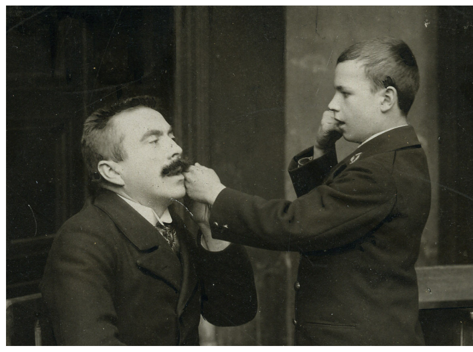
Histoire de l'éducation des sourds