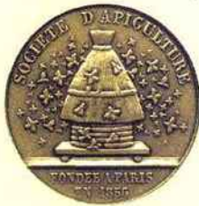
RUCHER DU JARDIN DU LUXEMBOURG